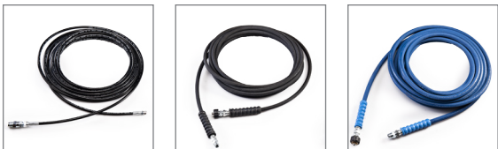
Tubo A.P. con raccordi L=10mt.