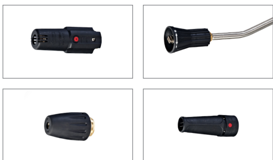
Lancia con impugnatura e ugello regolabile.