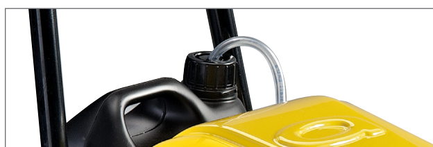
Aspirazione detergente in bassa pressione.