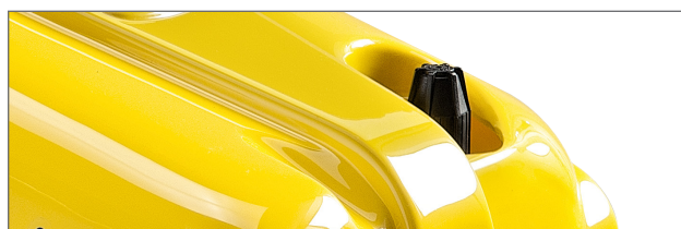
Comando a distanza in by-pass.

ALCE s.n.c. di ALESSI G. & C. | Via Tremarende, 6 - 35010 Villa del Conte (Padova) - Italy Tel. 049 9390075 | info@alceidropulitrici.it | www.alceidropulitrici.it