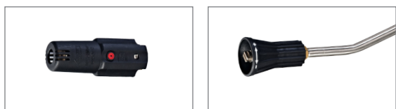
Lancia con impugnatura e ugello regolabile.