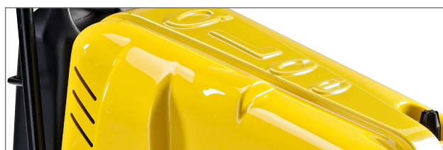
Copertura in materiale plastico resistente agli urti